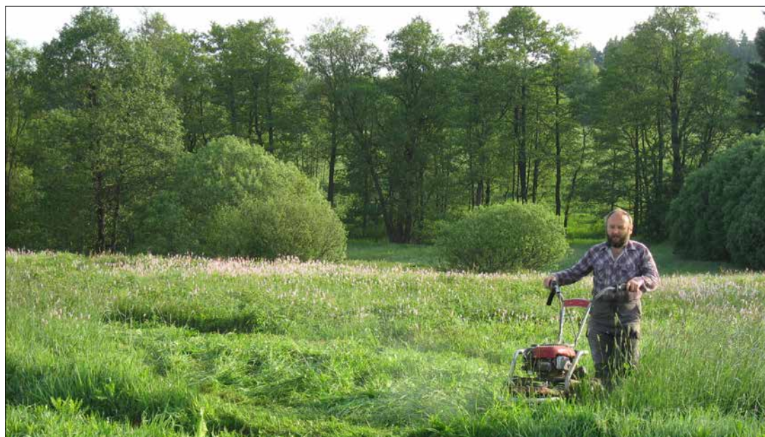
Kosení ručně vedenou sekačkou

hospodářů jako něco přežitého, jako sdělení bez aktuálního obsahu. Principy obsažené v rozhovorech je užitečné převést do současné praxe v ochraně přírody. Jde zejména o porozumění krajině a jejím přírodním zákonitostem a sladění toho všeho s potřebami a dovednostmi člověka. Do praktické ochrany přírody je dobré zapojovat místní komunitu, veřejnost a usilovat o to, aby lidé získávali vztah ke krajině a byli ochotni pro ni něco konkrétního udělat. Pořád se totiž nezměnila ta základní věc. Od stavu naší krajiny a přírody se odvíjí i kvalita našeho žití. Tato souvislost může být někdy užší, než se nám na první pohled může zdát. Zdravá a rozmanitá krajina je pro nás, naše zdraví a spokojenost stejně důležitá jako dobré sociální nebo ekonomické podmínky. Úsilí ani finanční prostředky vložené do praktické ochrany přírody proto nejsou zbytečně investované, a příroda a podmáčené květnaté louky nám to jistě vrátí.