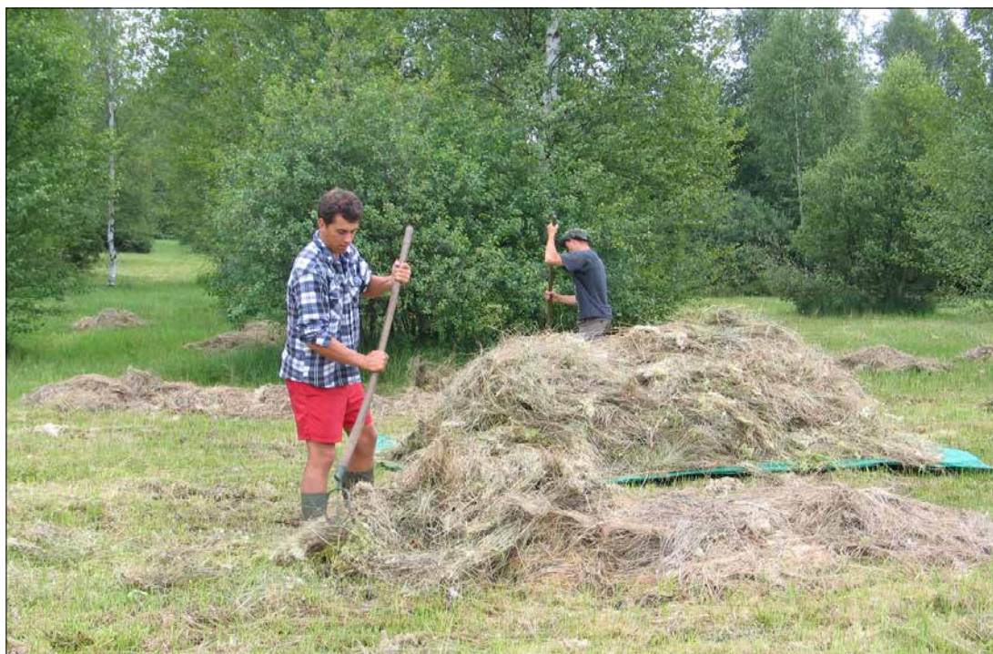
Ruční stahování pokosené trávy