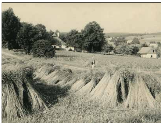
Sklizeň lnu (Samotín)

ručně, kdy se sešly ženské, které měly slezinu u lnu. To trhalo deset ženských ručně, možná i víc. Někdy udělaly půl hektaru za den. Len se vytrhal a rozprostřel na řádky. Když byl hodně hustý, tak se to někdy vyváželo na louku nebo strniště. Když už bylo hotovo, tak hospodář vezl ženský domů. Ty mu udělaly jako dožínkové věnce, jako dotrh. Taky potom ještě asi něco na náladu jim dal. Já nevím, co jim dával, ale měly trochu náladu ženský. A byly dobrý zpěvačky ve Vysokém. Když jich bylo víc, tak to bylo jako svatba. To bylo tak do padesátých let, pak už ne (F. Ťápal). To byla dodávka na váhu, chodili to kontrolovat. Vozilo se to s koňmi ke tkalcům do Nového Města do tírny (F. Kubík). Pamatuju si, že jsme ho přivezli domů, potom se vezl rozložit, aby se rosou zvlhčil, a pak se to na vozech tažených krávami vezlo do Hlinska (V. Malá).