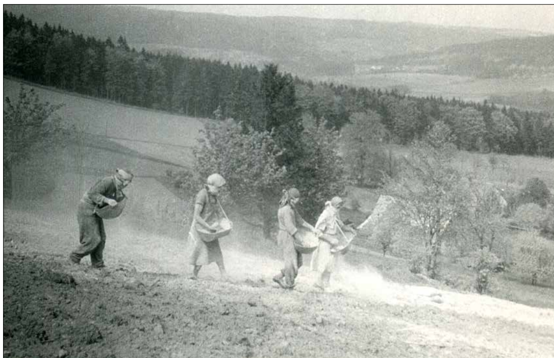
Ruční rozhazování vápna na poli (Blatiny, 50. léta 20. století)