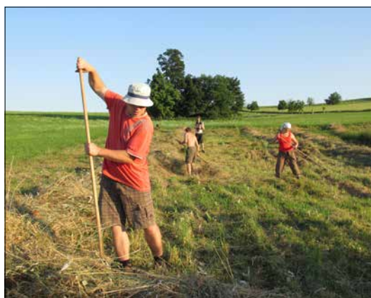
Ruční hrabání pokosené trávy