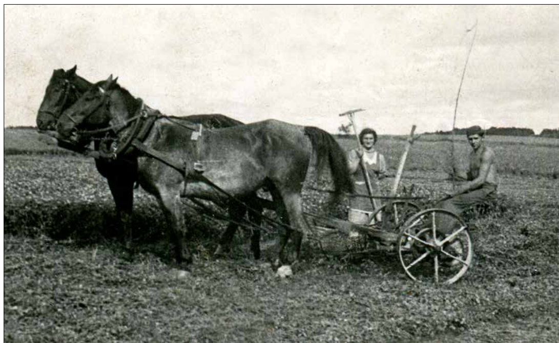
Košská potahová sekačka (Blatiny, 50. léta 20. století)