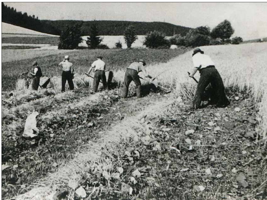
Kosení obilí (Samotín)