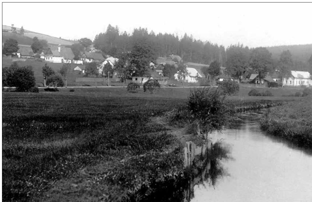
Náhon na řece Svatce na Křížánkách

Kosení luk probíhalo v jednom termínu. Bylo dohodnuté, že se všechno sekalo najednou. Byl povolený přejezd přes pozemky, ale muselo to být posekané zaráz, aby