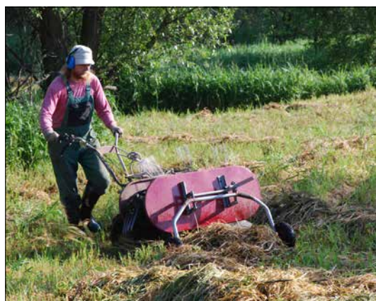
Hrabání pokosené trávy nahrabovačem