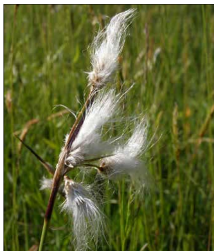
Suchopýr úzkolistý ( Eriophorum angustifolium )

Zastavení tohoto nepříznivého trendu bylo jedním z motivů pro vznik Chráněné krajinné oblasti Žďárské vrchy v 80. letech 19. století. První managementové krůčky ochrany přírody se nesly v duchu takzvaného konzervativního přístupu, a většina chráněných lokalit byla ponechána přirozenému vývoji, čili bez zásahu. Postupně se začal prosazovat aktivní přístup, výměra kosených luk opět rostla. Obnovením každoročního kosení, odstraňováním náletových dřevin nebo obnovou stružek se podařilo navracet louky do původního stavu. Díky bohaté semenné bance, kterou v sobě luka uchovávají, na většině z nich znovu rostou rostliny, které si tam staří hospodáři pamatují.