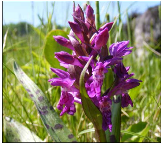
Prstnatec májový ( Dactylorhiza majalis )

Značnou druhovou pestrost vykazují také bezobratlí živočichové, jako jsou brouci, pavouci, mravenci a nejrůznější hmyz. Žije tam také řada nočních i denních motýlů. Za zmínku stojí modrásek bahenní, jenž je chráněn nejen českou legislativou, ale také celoevropsky v rámci soustavy NATURA 2000. Stejně je na podmáčené louky vázán u nás kriticky ohrožený hnědásek rozrazilový. Přežívají tam populace ohrožených druhů žab a čolků, ideálně, pokud je přímo na lokalitě, nebo v její blízkosti menší rybník s nízkou rybí obsádkou, nebo tůň. I pro populace dnes vzácných ptáků, jako je chřástal polní, koroptev polní, bekasina otavní, křepelka polní, hýl rudý, bramborníček hnědý a mnoho dalších, jsou domovem právě tyto biotopy.