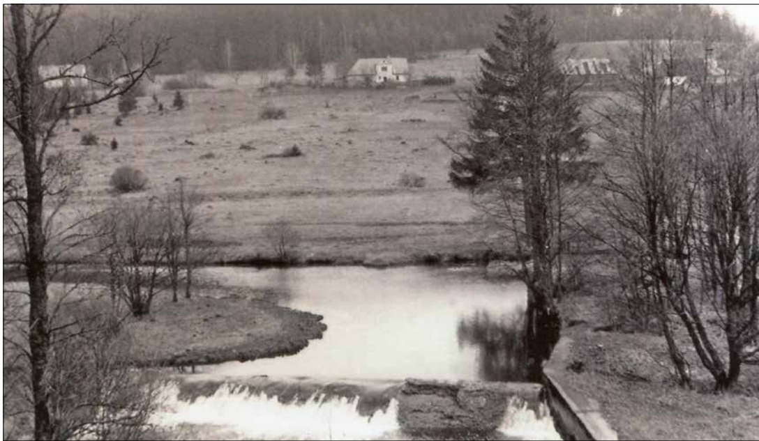
Splav na řece Svatce na Křižánkách obnovený v roce 1930

Podmáčené květnaté louky patří mezi nejcennější a druhově nejbohatší místa u nás. Jsou to ostrůvky v naší krajině, které vytvářejí domov mnoha vzácným a ohroženým druhům rostlin a živočichů. Pozitivně ovlivňují také klima okolní krajiny. Akumulují vodu a chrání nás tak před povodněmi i suchem. Tato malebná místa jsme zdědili po předcích a je tedy naší povinností je chránit, pečovat o ně a uchovat je tak i pro další generace.