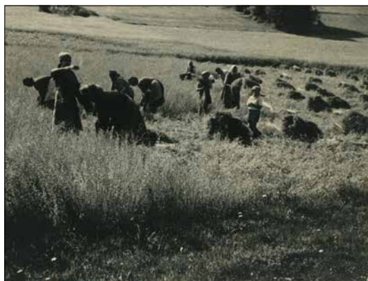
Ruční trháání lnu (Samotín)