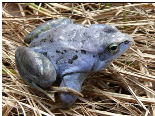
Skokan ostronosý ( Rana arvalis )