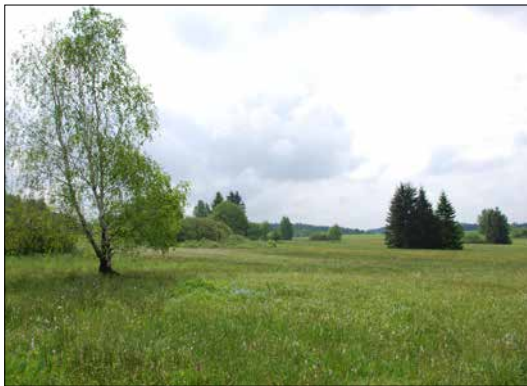
PP Suché kopce