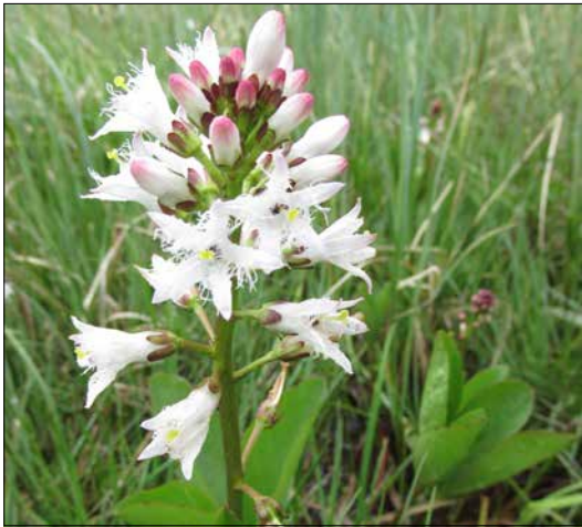
Vachta trojlistá ( Menyanthes trifoliata )