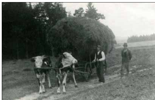
Sklizeň sena. Potah vede Bohumil Peňáz (Kadov, 1935)