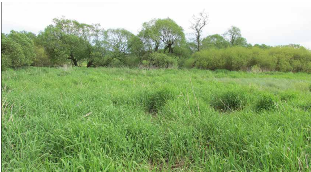
Degradovaná nekosená louka v PR Meandry Svatky u Milov