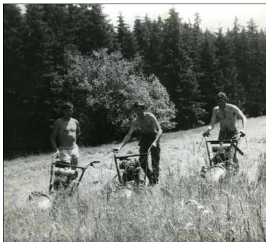
Sečení sena sekačkou MF (Blatiny)

Stroje se většinou používaly hlavně na polích a suchých lukách. Podmáčené louky se stále kosily ručně. Zvířata i větší stroje by zde totiž snadno zapadly.