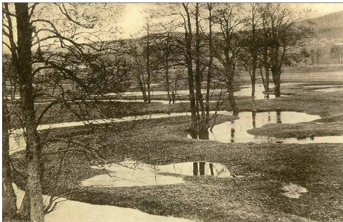
Jarní záplavy na Rychtářkách (dnešní PR Meandry Svatky u Milov) na přelomu 19. a 20. století