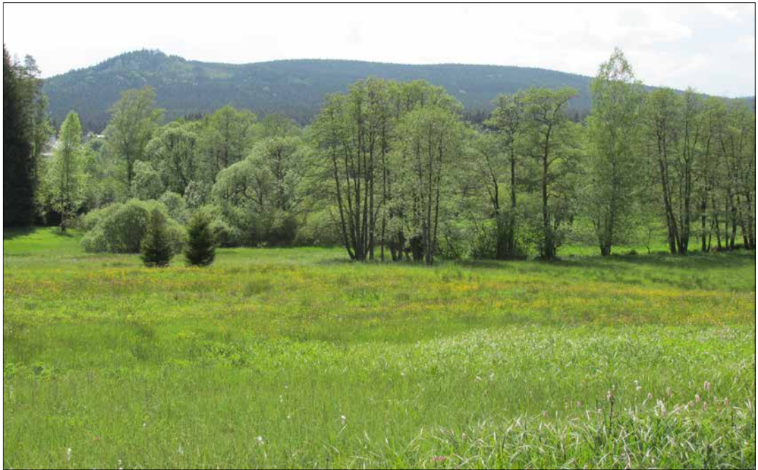
PR Meandry Svatky u Milov