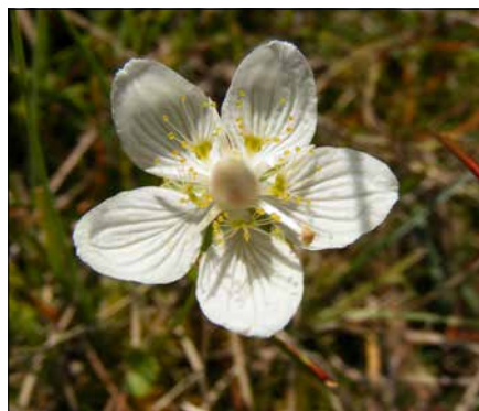
Tolie bahenní ( Parnassia palustris )