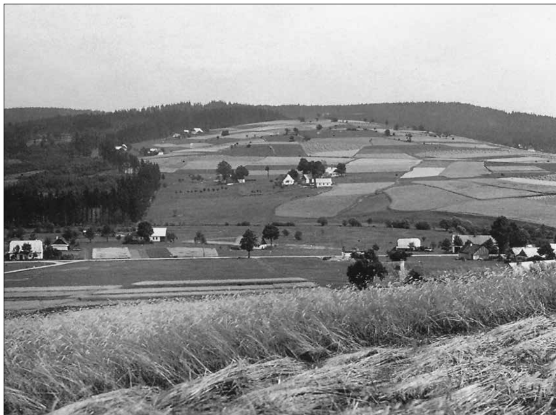
Mozaikovitá krajina v okolí Křižánek

Za soukromého hospodaření jsme měli pole rozházené „cik cak“. Tamhle něco, tamhle něco. Zakládající družstvo si to pak dalo do celku. Vybraly si prostě ty nej-