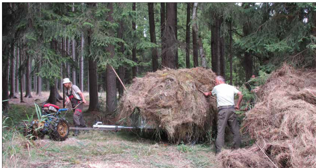
Svážení pokosené trávy