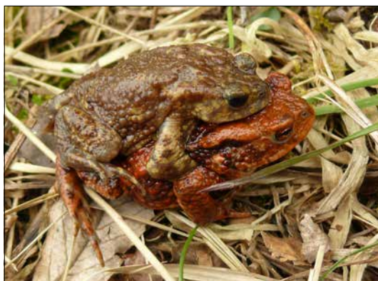
Ropucha obecná ( Bufo bufo )