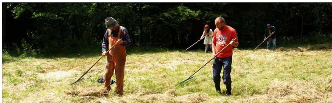
Ruční hrabání pokosené trávy