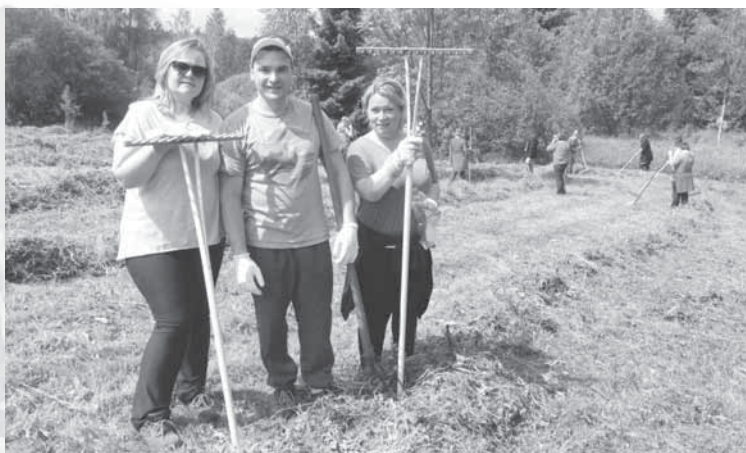
13. 6. 2016 Dobrovolníci z Makra na Blatinách