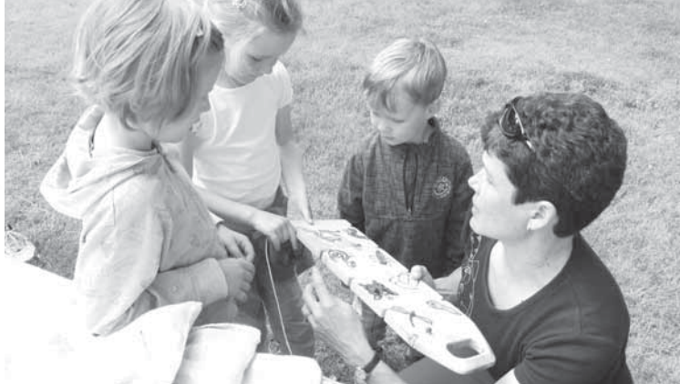
28. 5. 2016 Otevřené zahrady