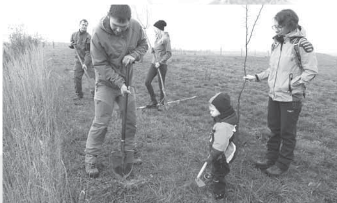
31. 10. 2016 Sázení