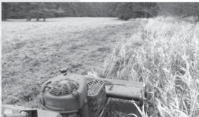
listopad 2016 Asanace drnu na lokalitě Bahna a Utopenec