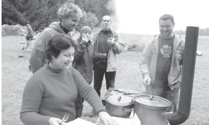
15. 10. 2016 Dosečná