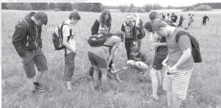
13. 6. 2016 ZŠ Kameničky na Loukách v Jeníkově