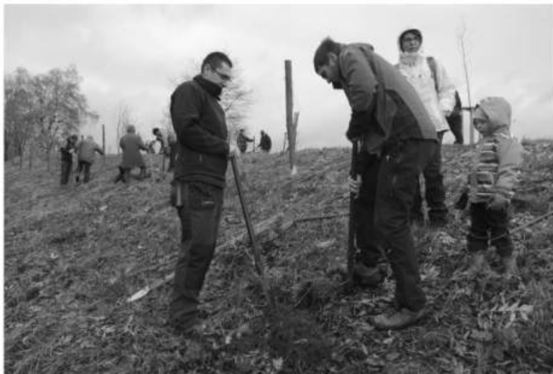
11.11.2017 Černobílo Martinský Spolubál v Novém Městě na Moravě