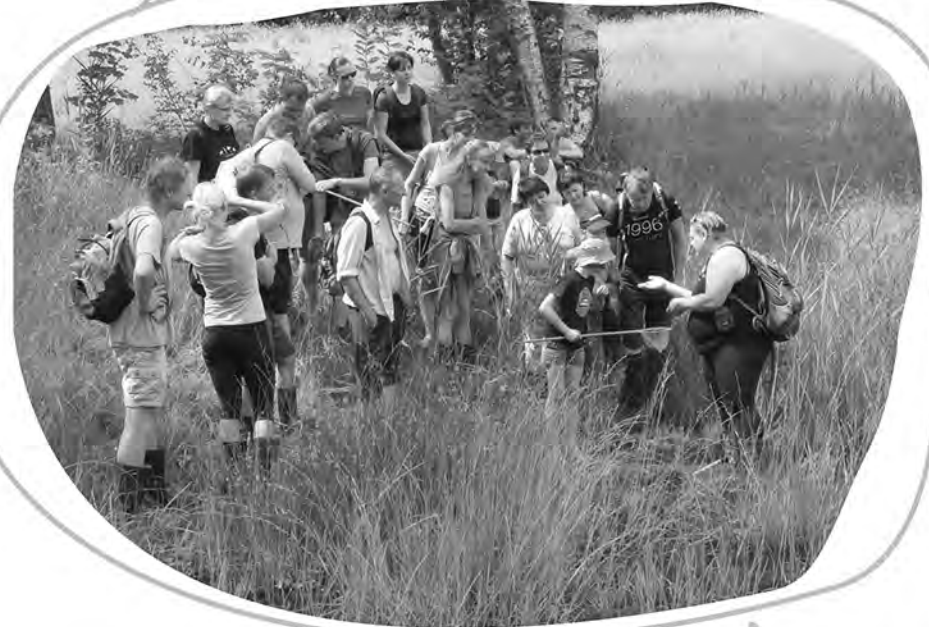
9. 6. 2019 – Botanická vycházka