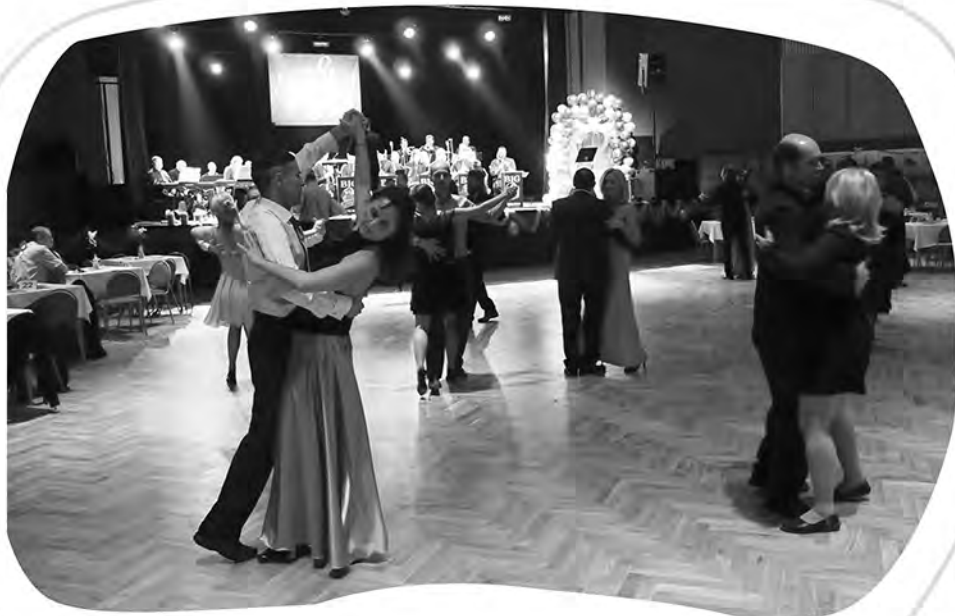
9. 11. 2018 – Spolubál