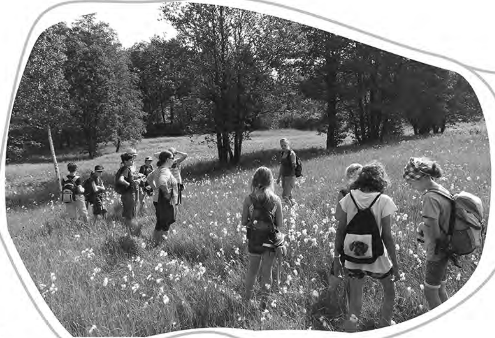
29. 5. 2018 – Exkurze se Školou Na Radosti