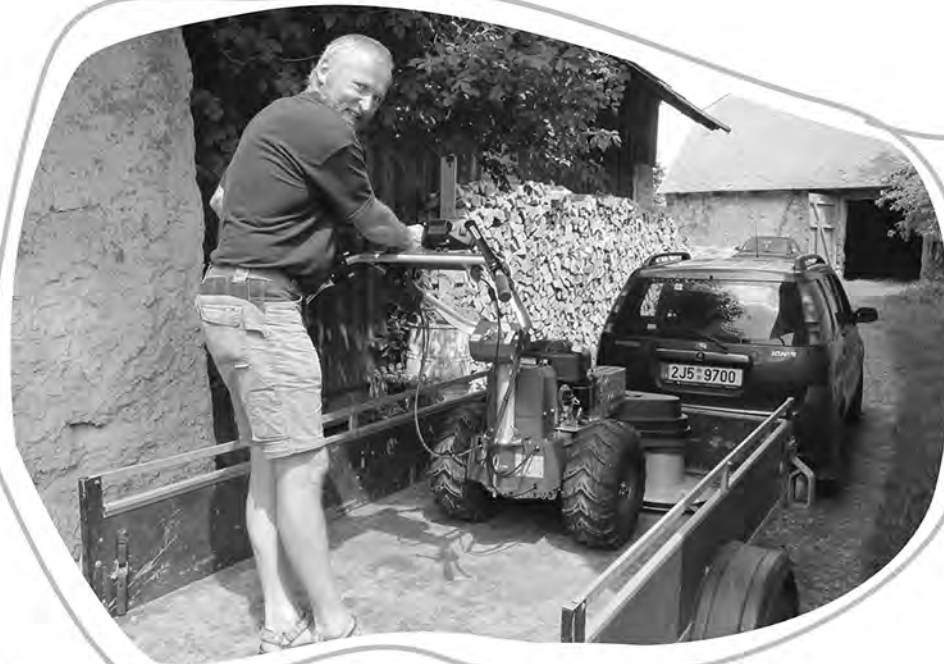
Chystáme sekačky na letní práci na loukách