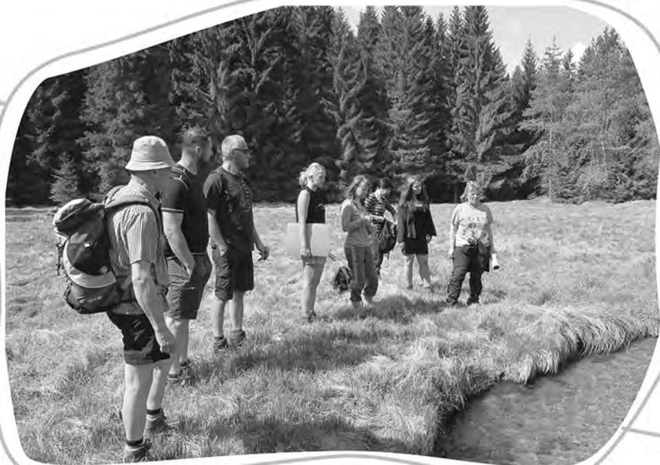
3.– 4. 5. 2018 – Exkurze Šumava