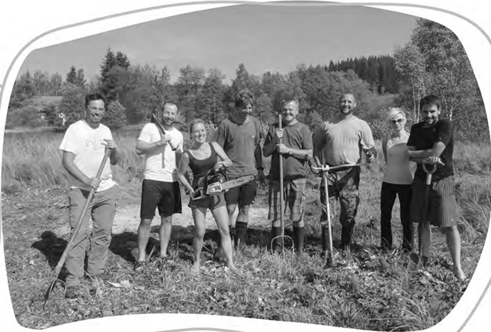
20.-21. 9. 2018 – Dobrovolníci z ČSOB pojišťovny Pardubice