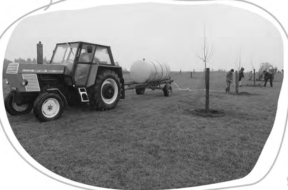
3. 11. 2018 – Výsadby Budeč