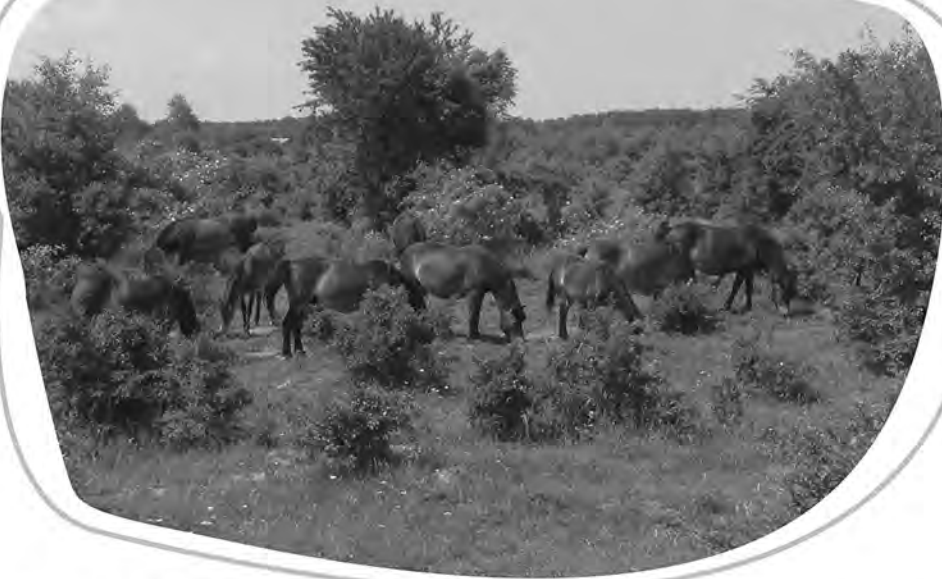
27. 5. 2018 – Výlet do Milovic