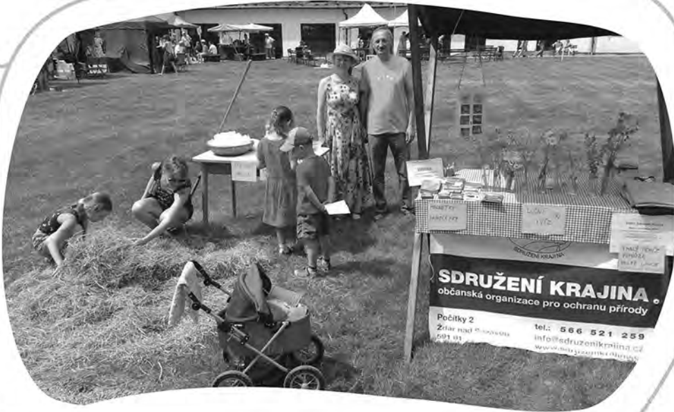
26. 5. 2018 – Otevřené zahrady