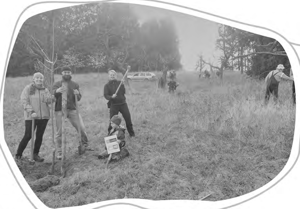
2. 11. 2018 – Výsadby Vříšť