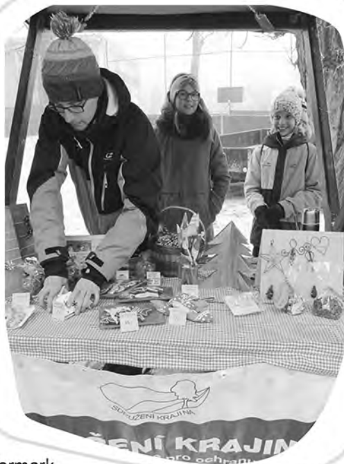
2. 12. 2018 – Adventní jarmark