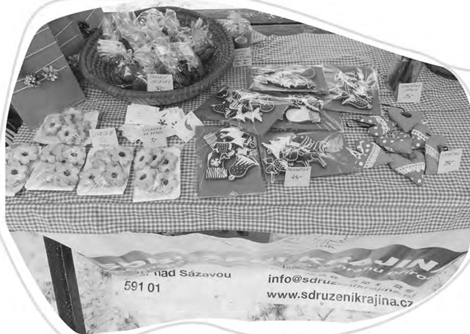
21. 12. 2018 – Vánoční večírek