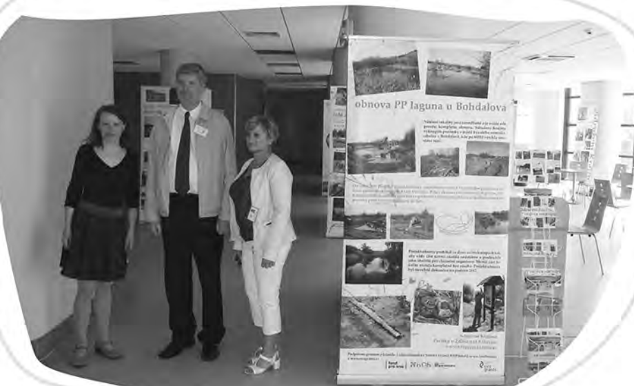
20. 4. 2018 – Vernisáž v nemocnici v Novém Městě na Moravě