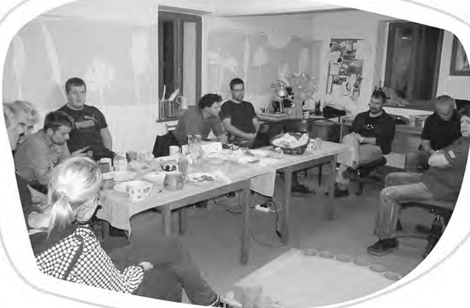
6. 2. 2018 – Setkání praktiků