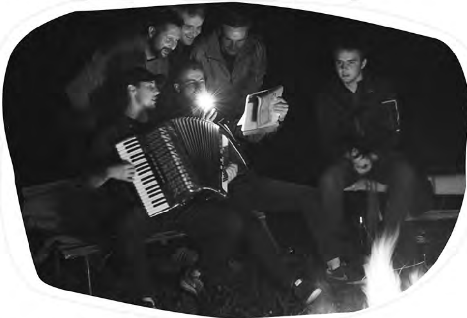
13. 10. 2018 – Dosečná