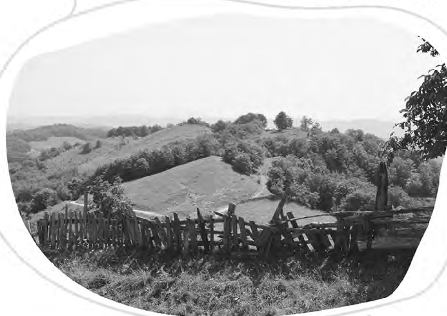
6.–10. 5. 2018 – Výlet do Banátu