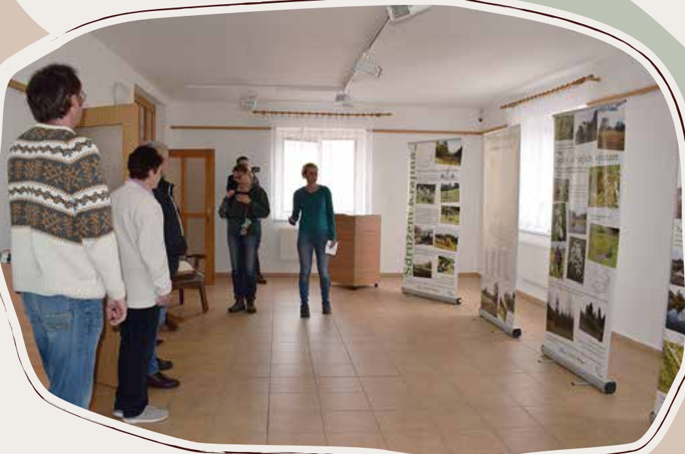
19. 4. Výstava Zaostřeno na KRAJINU, Galerie Doubravka, Žďárec n. D.