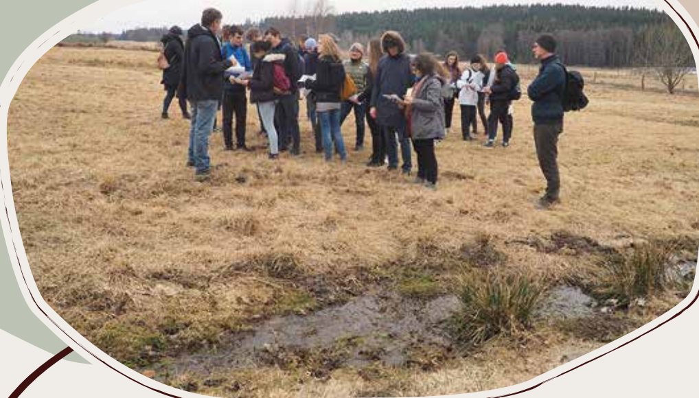
15. 3. Workshop studentů, projekt Education for Sustainable Development, Počátky