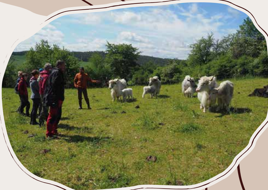
20. - 21. 5. Exkurze CHKO Český Les, ČSOP Libosváry