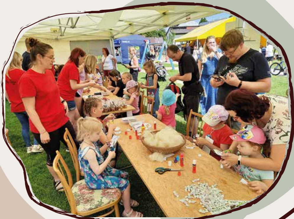
11. 6. Dny Žďáru, Žďár n. Sáz.