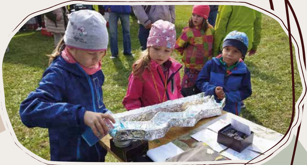
24. 9. Dny venkova