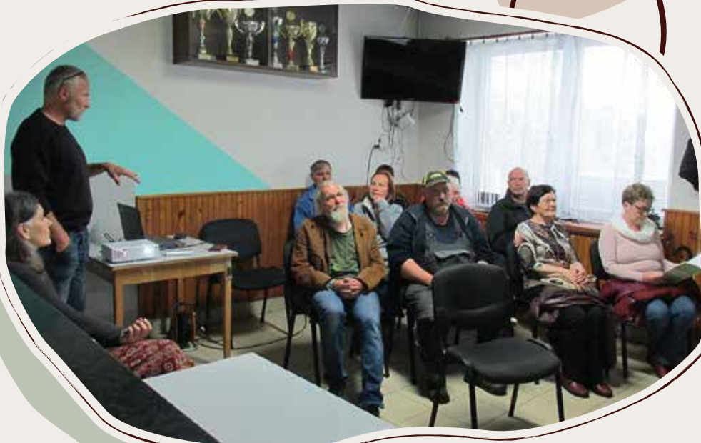
24. 5. Beseda o Pastviskách, KD Odranec