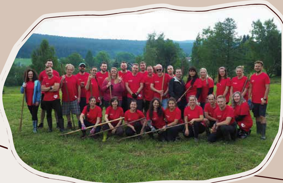
9. 6. Firemní dobrovolníci MONETA Money Bank, louka U Studní, Fryšava