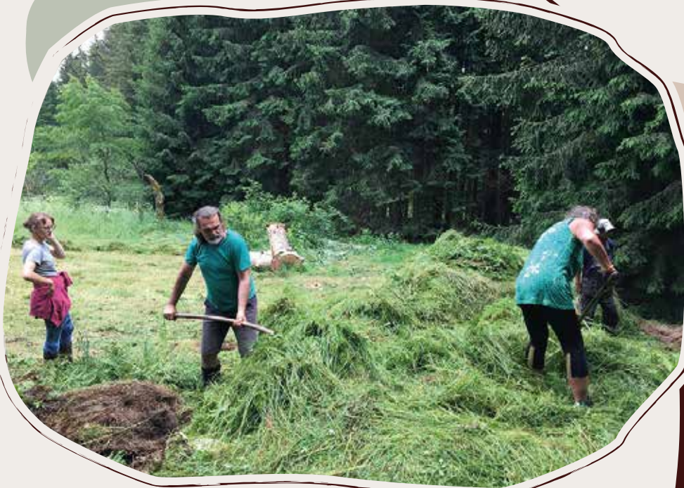
24. - 25. 6. Dobrovolnická kosící a hrabací akce, Štursův sad, Líšná