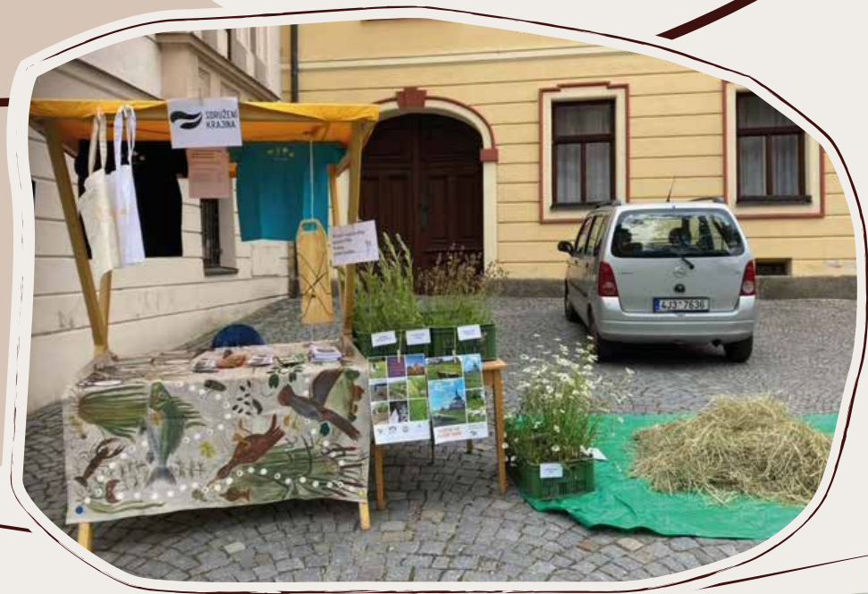
18. 6. Nova Civitas, Nové Město n. Mor.