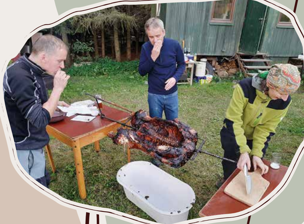
8. 10. Dosečná