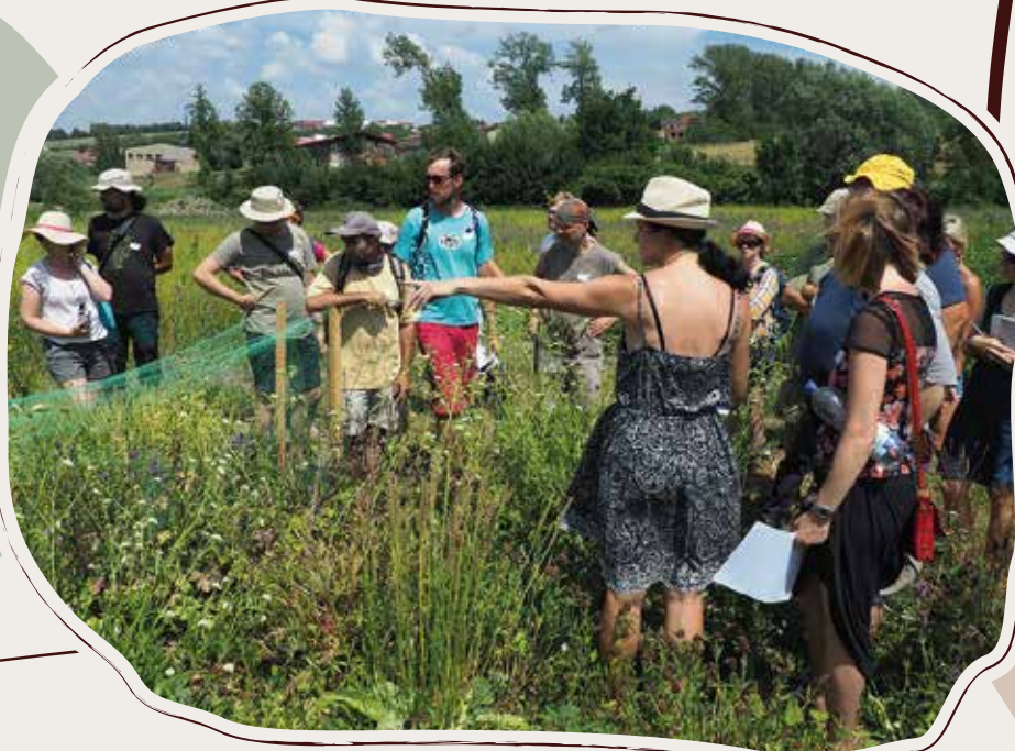
1.7. Regionální osivo, exkurze kolem Strážnice