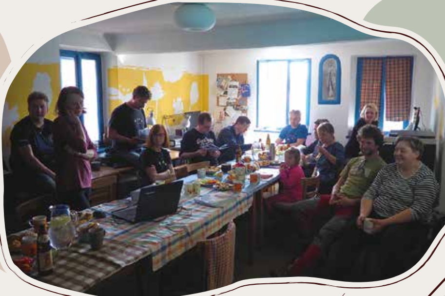
26. 3. Sněm Sdružení Krajina, Počátky