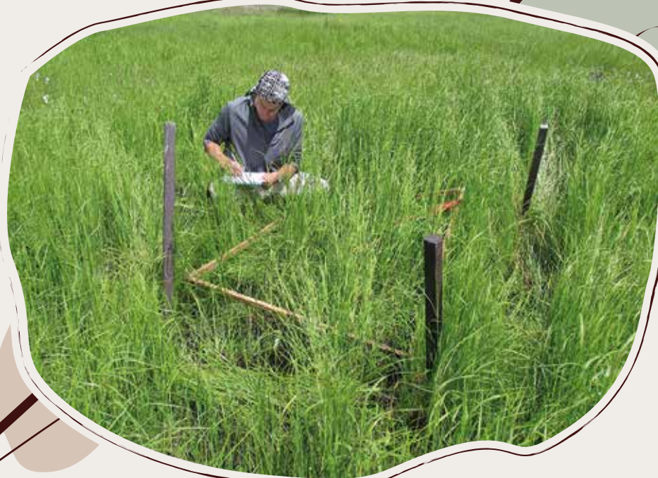
30. 5. Monitoring s Tomášem Peterkou