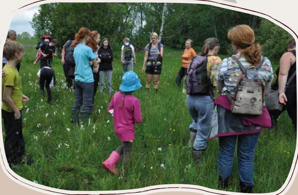
4. 6. Botanicko-zoologická vycházka, PP Ratajské rybníky, Hlinsko