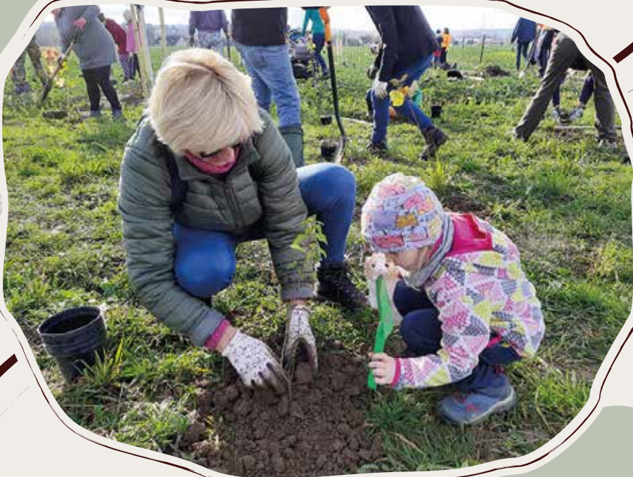
12. 11. Podzimní výsadby podél obnovené polní cesty, Žďár n. Sáz.