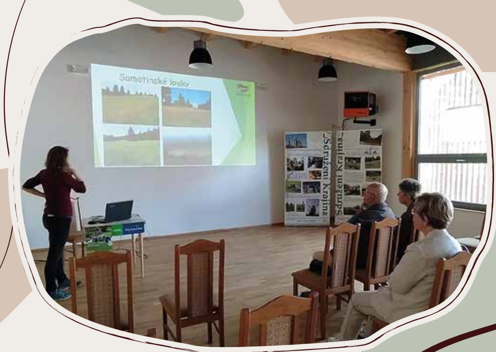
26. 5. Beseda Sdružení Krajina na Sněžensku, OÚ Sněžné